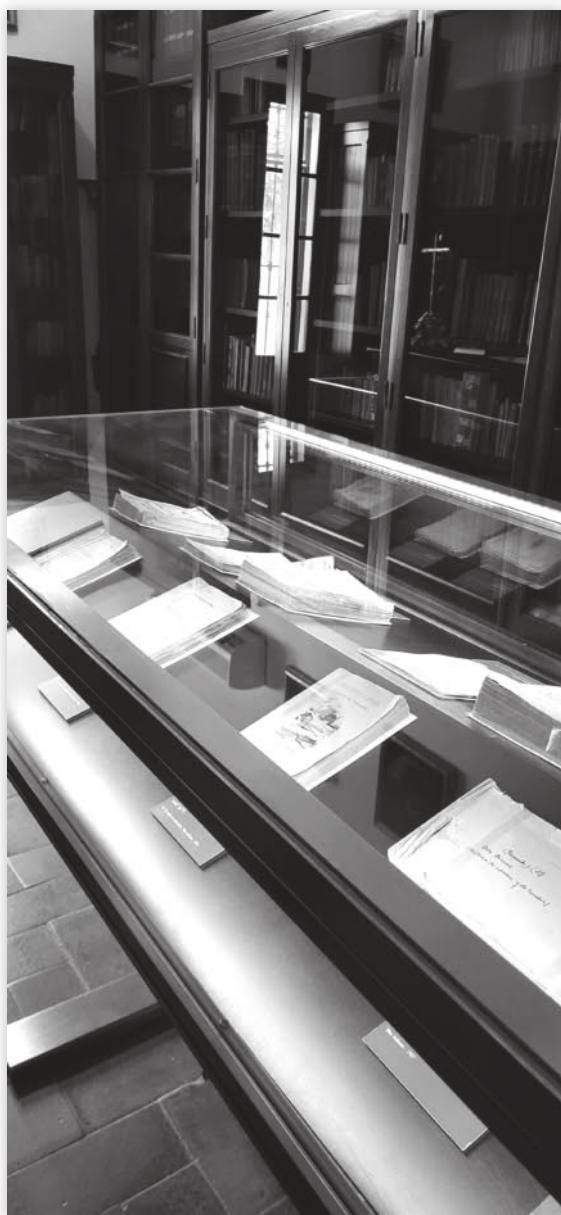
En esta página y la siguiente, imágenes de la Biblioteca de Blas Infante en su casa Dar al-farah (Casa de la Alegría) en el Museo de la Autonomía de Andalucía.