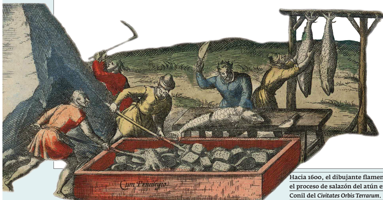
Hacia 1600, el dibujante flamenco Joris Hoefnagel reprodujo el proceso de salazón del atún en el detalle de su vista de Conil del Civitates Orbis Terrarum .

Con algunas excepciones notables, como la captura del atún por los púnicos de Gades en el banco pesquero sahariano, la pesca en las sociedades antiguas y tradicionales es básicamente una actividad litoral y no de altura. Sin embargo, hay que distinguir, en la línea de lo que venimos señalando para el área del Estrecho y de la costa mediterránea, una pesca de subsistencia o de abastecimiento local, de nivel técnico y organizativo adaptados en cada caso a las necesidades del suministro alimenticio, y una pesca comercial e industrial enfocada a la exportación