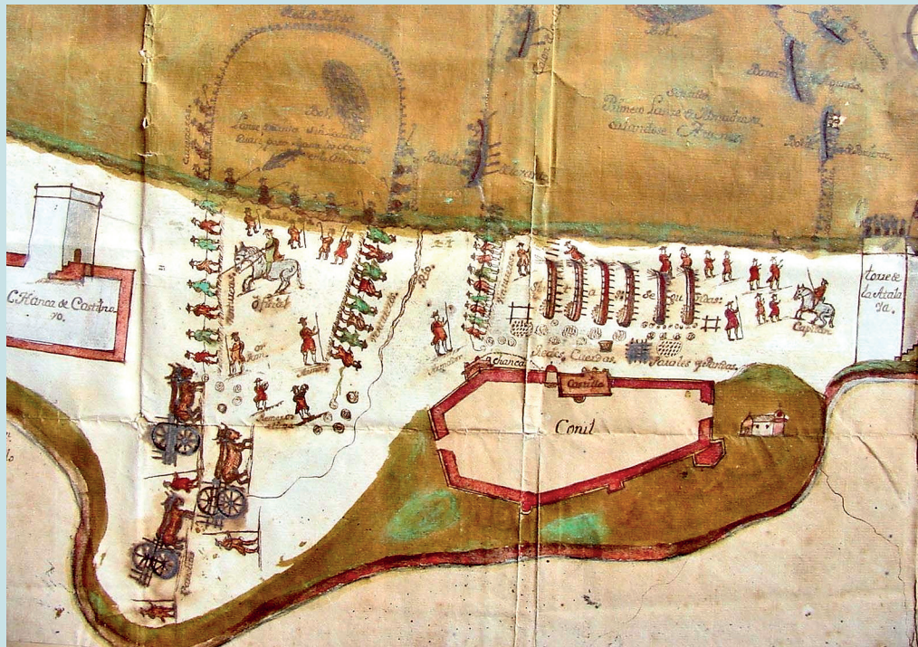
Plano de una almadra de tiro en Conil en el siglo XVIII.