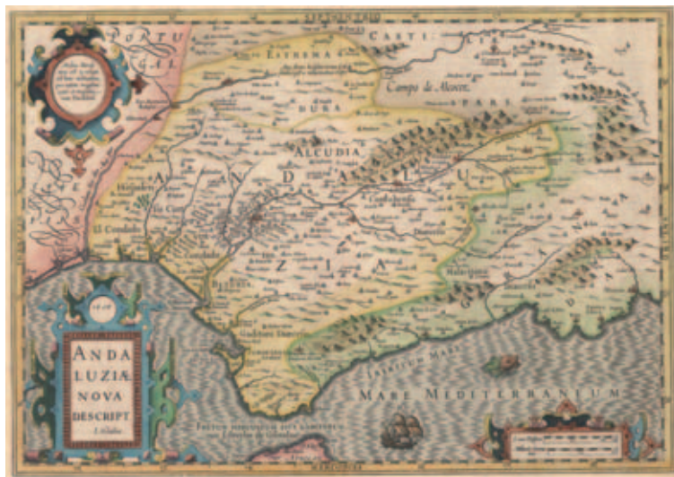
Andaluziae nova descriptio , primer mapa impreso del conjunto de Andalucía, J. Hondius, Amsterdam, 1606. Instituto de Estadística y Cartografía de Andalucía.