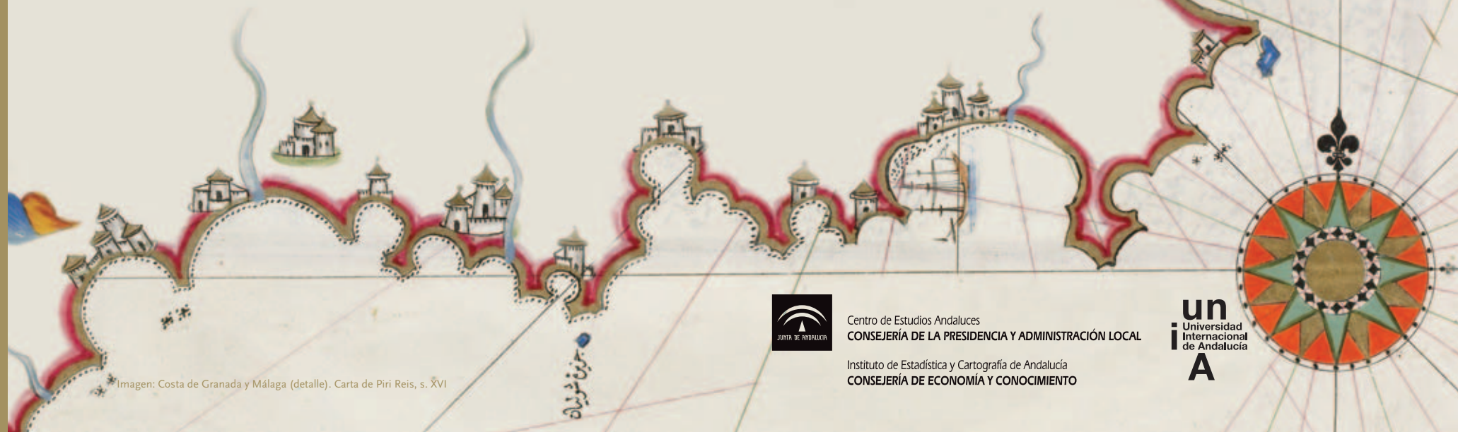
*Imagen: Costa de Granada y Málaga (detalle). Carta de Piri Reis, s. XVI