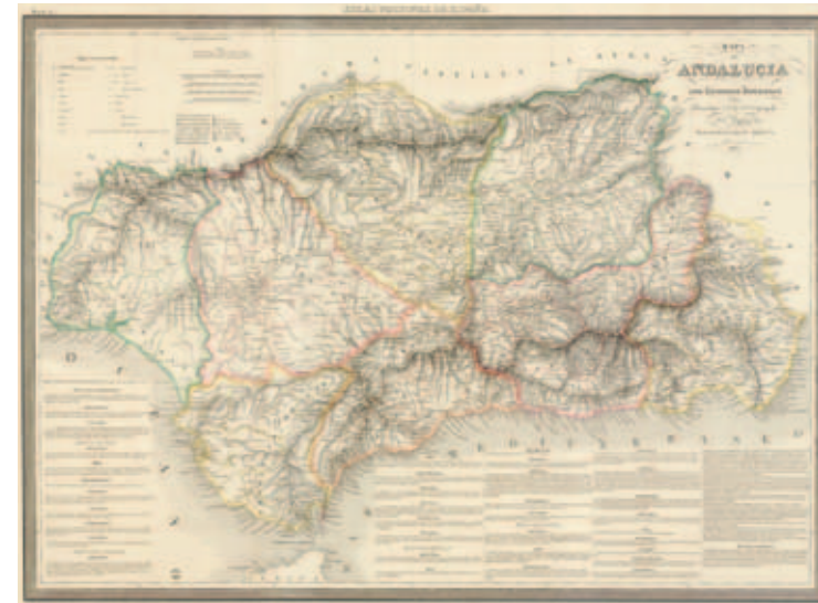
Primer mapa de Andalucía con la división en ocho provincias, por A. H. Dufour, París, 1837. Instituto de Estadística y Cartografía de Andalucía