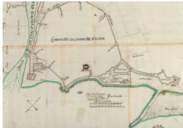
Planta de la plaza de Málaga (detalle), Hércules Torelli, 1694. Ministerio de Educación, Cultura y Deporte, Archivo General de Simancas.