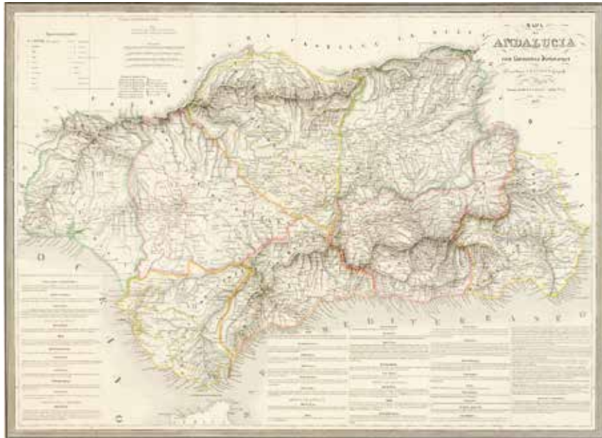
Primer mapa de Andalucía con la división en ocho provincias, por A. H. Dufour, París, 1837. Instituto de Estadística y Cartografía de Andalucía