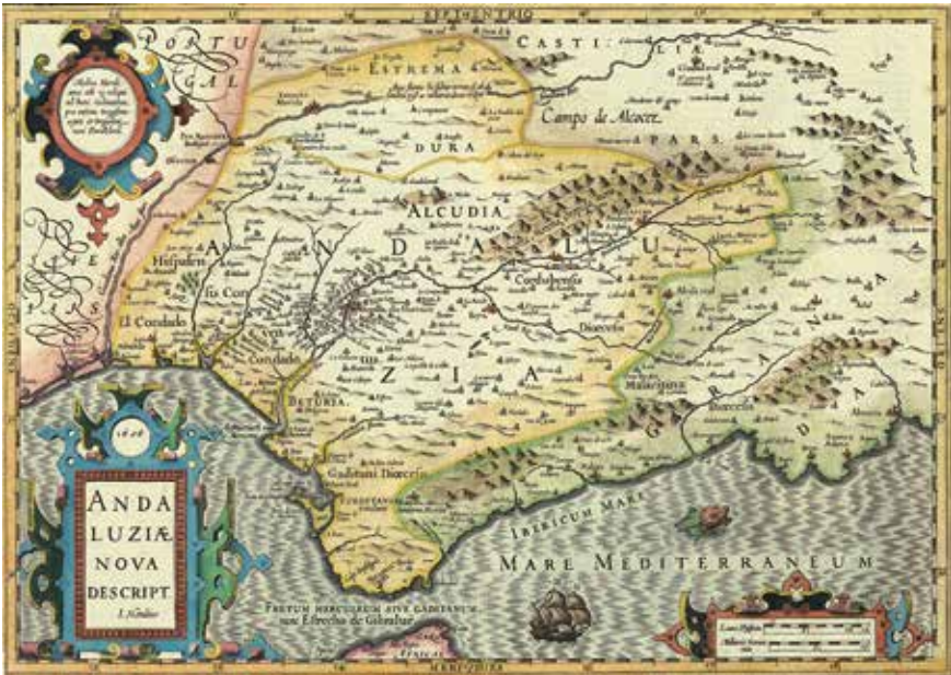
Andaluziae nova descriptio , primer mapa impreso del conjunto de Andalucía, J. Hondius, Ámsterdam, 1606. Instituto de Estadística y Cartografía de Andalucía