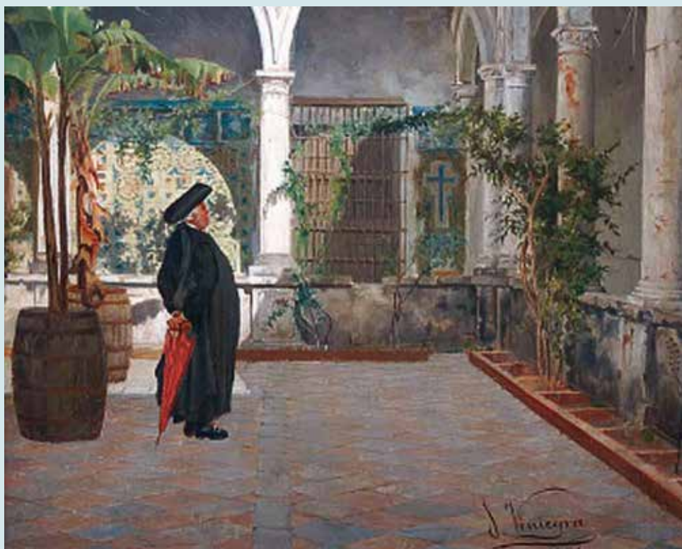
Patio del Convento de San Francisco de Cádiz , óleo de Salvador Viniegra (1881).