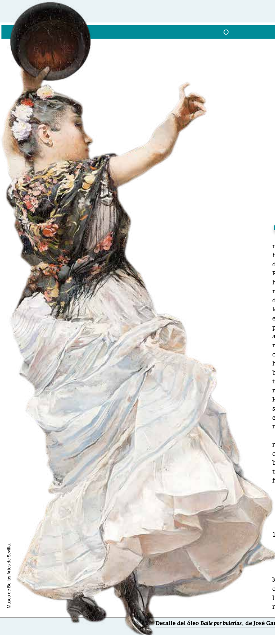
Museo de Bellas Artes de Sevilla.

A ndalucía ha fascinado a viajeros desde tiempos inmemoriales y ha llenado miles de páginas de crónicas y relatos que han dado forma a la imagen de la comunidad que hoy se proyecta en todo el mundo. Pocas regiones europeas cuentan con una historia tan rica en textos y artes visuales realizados por viajeros que vinieron de todos los rincones del mundo cautivados por los encantos del sur. Desde las crónicas escritas en tiempos del Imperio romano pasando por los relatos de los viajeros de al-Andalus hasta la visión de los escritores románticos y de la Guerra Civil. Las crónicas de estos intrépidos aventureros, tanto hombres como mujeres, son imprescindibles para entender la historia social, política y cultural del sur de la península. Sus relatos de viaje, a medio camino entre la Historia y la Literatura, sobre hechos y personajes, patrimonio y costumbres, paisajes e instituciones ofrecen una visión complementaria al discurso oficial.