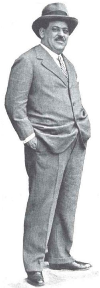
El general Sanjurjo, enviado en avión a Sevilla por el Gobierno para sofocar la tentativa revolucionaria de Tablada.

Las primeras declaraciones de las autoridades sobre lo acontecido trasladan palabras de tranquilidad. Así se pronuncia el director de Seguridad, Ángel Galarza, de mismo tenor son las declaraciones del ministro de la Guerra, Manuel Azaña, y del ministro de la Gobernación, Miguel Maura, que confirmaron el 27 de junio que había tranquilidad en Sevilla 42 . Sin embargo, en el diario La Voz se publica en la portada del 27 de junio otro titular de corte alarmante 'hoy circularon por Madrid y por el resto de España rumores alarmantes de unos supuestos sucesos desarrollados en el aeródromo de Sevilla' 43 .